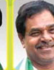
శ్రీ బి. వెంకటేశ బాబు ఎం.ఎల్.ఎ. - గంగాధర నెల్లూరు