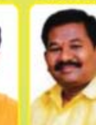
శ్రీ డి. వెంకటేశ బాబు ఎం.ఎల్.ఎ. - కొండేపేట