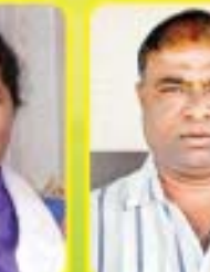
శ్రీ యస్. మణి గౌండ్ ఎం.ఎల్.ఎ. - కోమరూరు