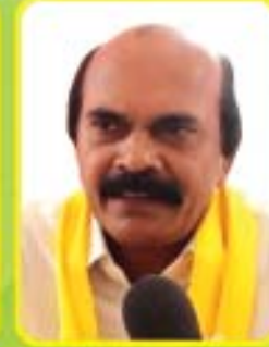
శ్రీ శ్రీ రాము చూలూరు ఎం.పి. - బాపట్ల