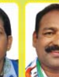
శ్రీ యస్. రోజులు ఎం.ఎల్.ఎ. - రాజం