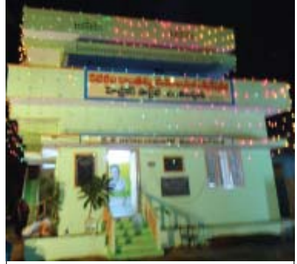
చింతలపూడిలోని కటికల కాంతమ్మ మెమోరియల్ ఎడ్యుకేషనల్ అండ్ హెల్త్ కేర్ సొసైటీ ప్రధాన కార్యాలయం