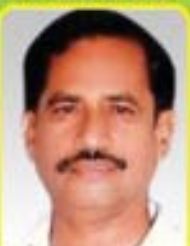
శ్రీ యస్. వెంకటేశ బాబు ఎం.ఎల్.ఎ. - రెంపల్లెపాడు