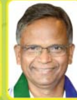
శ్రీ బి. వెంకటేశ బాబు ఎం.పి. - తిరుపతి