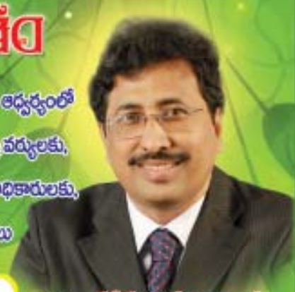
స్వగృహ కేటీఆర్ లబ్ధిభాగ్యరావు వ్యవస్థాపకులు & చైర్మన్ (IRS (VRS)) స్వగృహ గ్రూప్ ఆఫ్ అర్గనైజేషన్స్