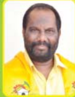
శ్రీ బి. వెంకటేశ బాబు ఎం.పి. - అమలాపురం