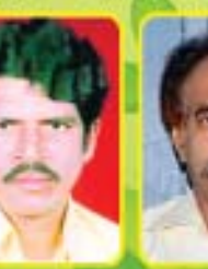
శ్రీ యస్. చిరంజీవులు ఎం.ఎల్.ఎ. - పార్వతీపురం