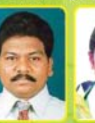
శ్రీ డి. వెంకటేశ బాబు ఎం.ఎల్.ఎ. - సోబూరు