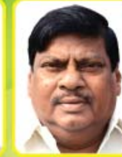
డా॥ యస్. - రవిప్రసాద్ ఎం.పి. - చిత్తూరు