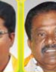
శ్రీ యస్. సూర్యారావు ఎం.ఎల్.ఎ. - రాజోలు