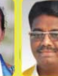
శ్రీ బి. వెంకటేశ బాబు ఎం.ఎల్.ఎ. - తమిళాపురం