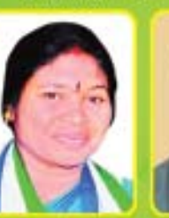
శ్రీ మతి పి. కామల ఎం.ఎల్.ఎ. - పాపిర్రు