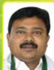
శ్రీ బి. వెంకటేశ బాబు ఎం.ఎల్.ఎ. - గూడూరు